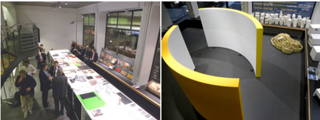
Projects: DW_Akustik www.dfab.arch.ethz.ch

Koordination Fabian Valverde. ( PDF in der Beilage )