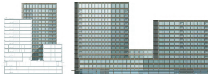
Die zwei im Grundriss versetzten Türme bilden eine Einheit auch dank ihrer Materialisierung.