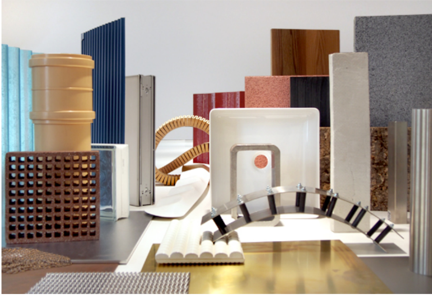
Die Klangmuster der Schweizer Baumuster-Centrale Zürich als Leihgabe