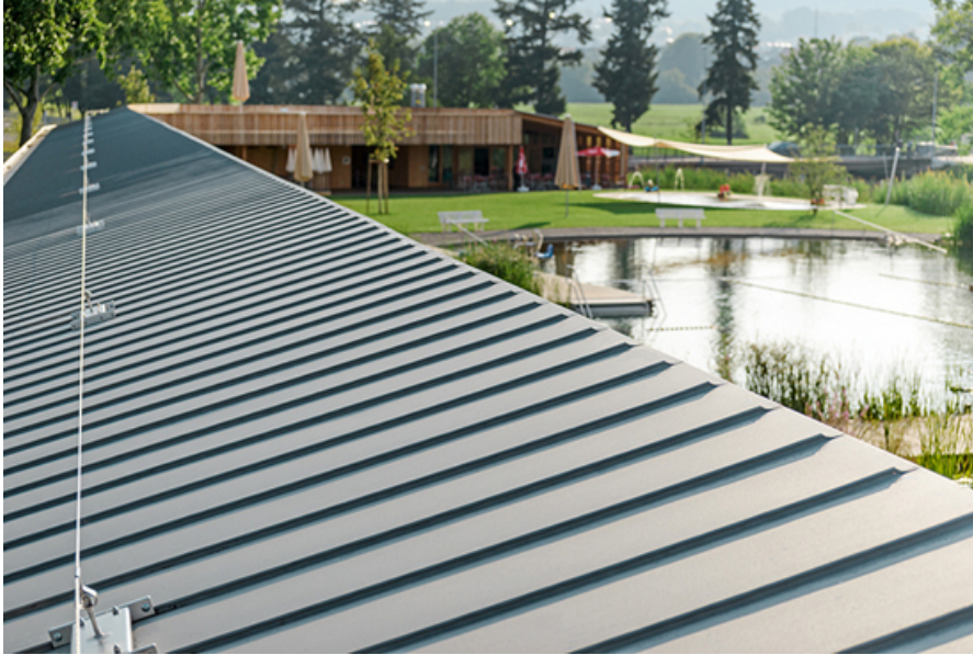
Das Dach des Naturbades in Riehen bei Basel, Projekt 319 Herzog & de Meuron Architekten, 2014