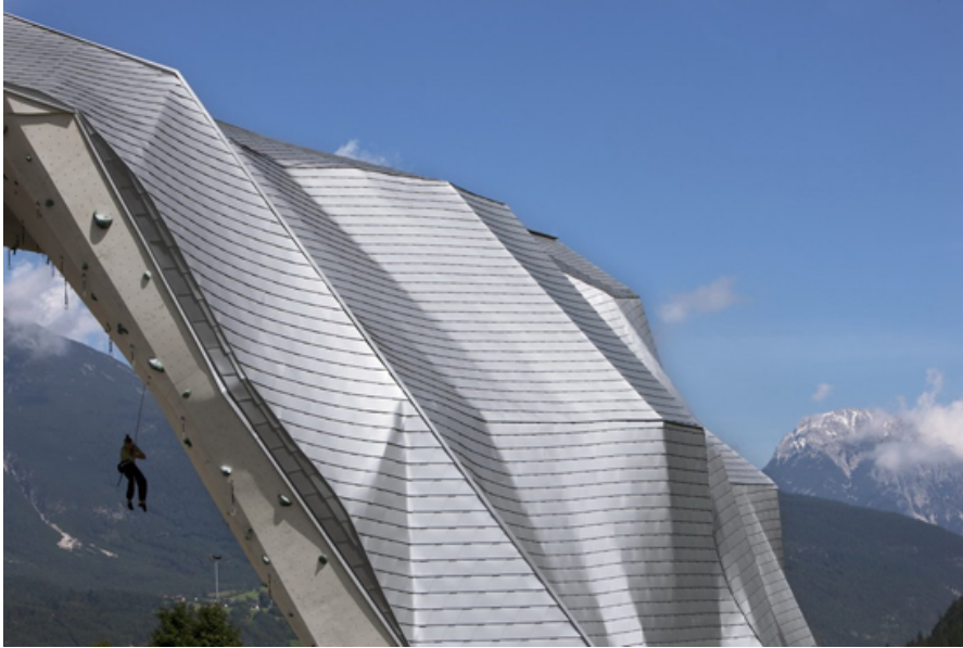
Dachneigungen 25 bis 90 Grad, Kletterzentrum in Imst, Tirol, Österreich, Architekt DI Markus Volgger, 2009

2001 wurden der Slogan «Das Dach, stark wie ein Stier!» und das Firmenlogo geschaffen, die den Ruf von Alumineindeckungen mit langer Lebensdauer und Rezyklierfähigkeit festigen sollen.