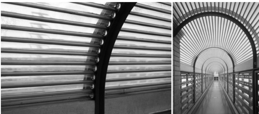
Verbindungsgang zum Turm nach der Renovation, Frank Lloyd Wright Architekt

Frank Lloyd Wright kommt uns beim Betrachten der Bilder unweigerlich in den Sinn. Auch wenn die Prämissen damals anders gelagert waren als heute, fasziniert uns die experimentelle Fassade am SC Johnson Research Tower der Firma Johnson Wax am Hauptsitz in Racine, Wisconsin.