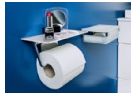
WC-Papierhalter mit Ablagefläche.