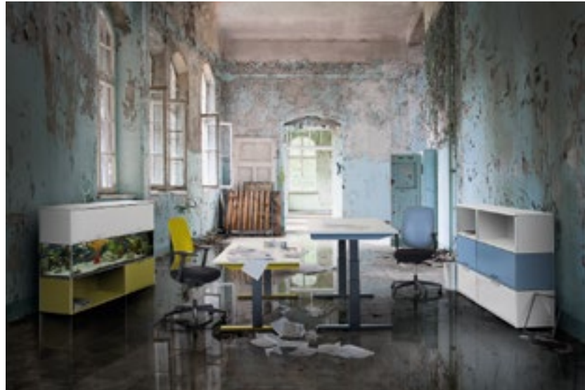
Gebäude verfallen, «eQ» lebt – zum Beispiel als Arbeitsplatz-Einrichtung.

Weitere Informationen finden Sie auch unter www.espazium.ch