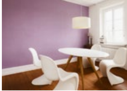
Lösemittelfreie Farbe für Innenräume.