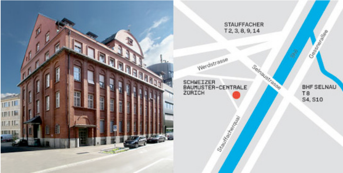
Weberhaus , Weberstrasse 4, 8004 Zürich

Öffnungszeiten: Mo. - Fr. von 9-17.30 Uhr Donnerstags bis 20 Uhr