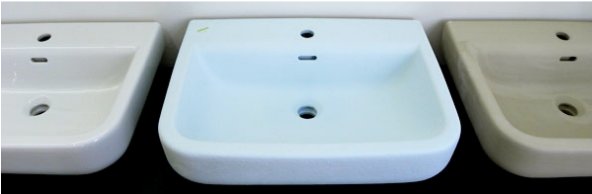
Lavabo LAUFEN FORM, Phoenix Design, von Rechts nach Links roh, glasur matt und gebrannt glänzig

Produziert wird neben Österreich und Tschechien immer noch in Laufen, dem gleichnamigen Ort im Kanton Baselland. Der Ton, ein Gemisch aus fünf Tonerden kommt heute aus England und Tschechien. Die plastische Masse wird als giessfähiger Schlacker in Gipsformen eingefüllt oder im Druckgussverfahren gepresst und nach einer Stunde entformt. Überlauf und hohle Ränder entstehen in diesem ersten Schritt.