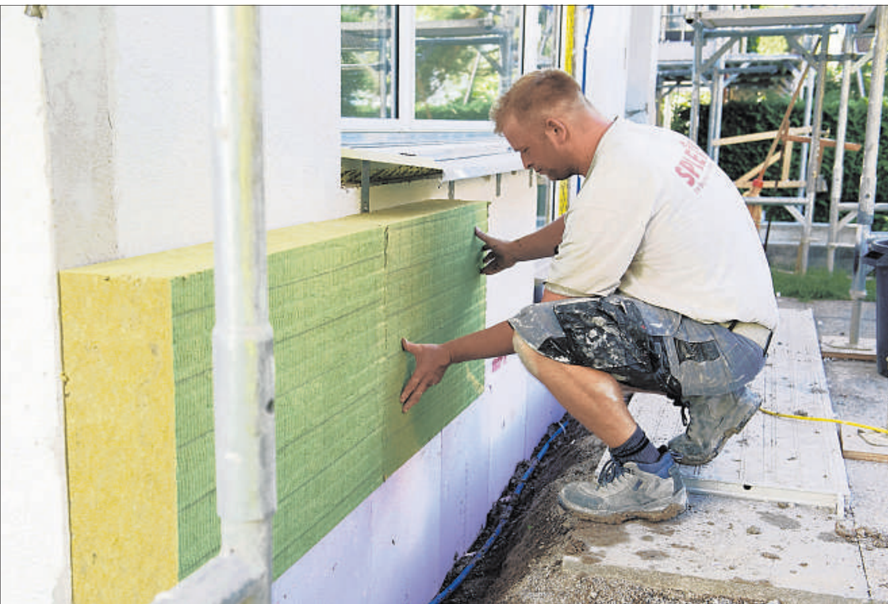
Für das Dämmen der Gebäudehülle stehen Fördergelder aus dem «Gebäudeprogramm» zur Verfügung.