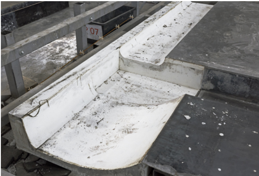
Schalungsform der Elemente

In der SBCZ Schweizer Baumuster-Centrale Zürich liegt die reich bebilderte Publikation «Neue Silhouetten», Projekte von Marcel Meili, Markus Peter Architekten in City West Zürich für CHF 25 zum Verkauf auf.