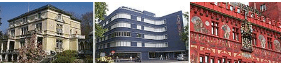
Villa Patumbah und Hotel Greulich in Zürich, Basel Rathaus am Markplatz

Der Forscher erhielt 1878 ein kaiserliches Patent für seine Keim'schen Mineralfarben, welche bei den damals beliebten Fassadenziermalereien neue Massstäbe bezüglich Beständigkeit, Colorit und Lichtreflexion setzten. Bald sprach man vom kristallinen Leuchten der Keim'schen Mineralfarben.